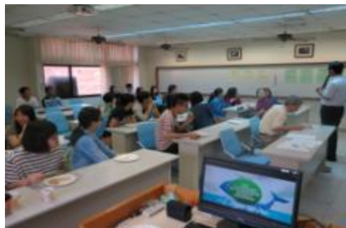
103/06/2012年國教理念宣導會