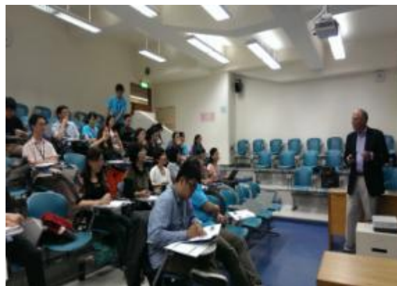
103/04/25專案式學習工作坊