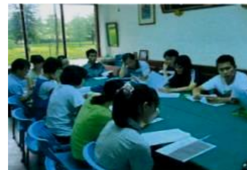
後壁高中國際教育教師社群