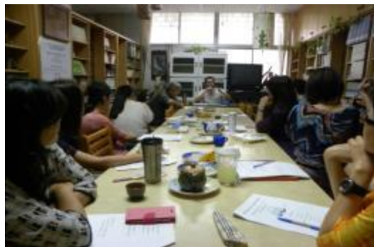
東石高中生命教育教師社群