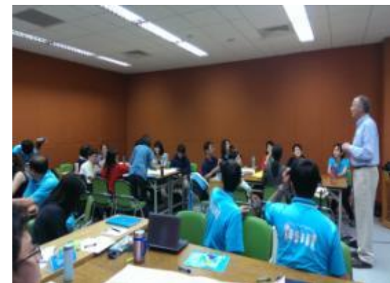
103/04/25專案式學習工作坊